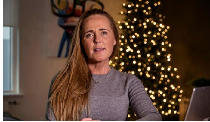
360.000 krónur á klukkutíma í spilakassa