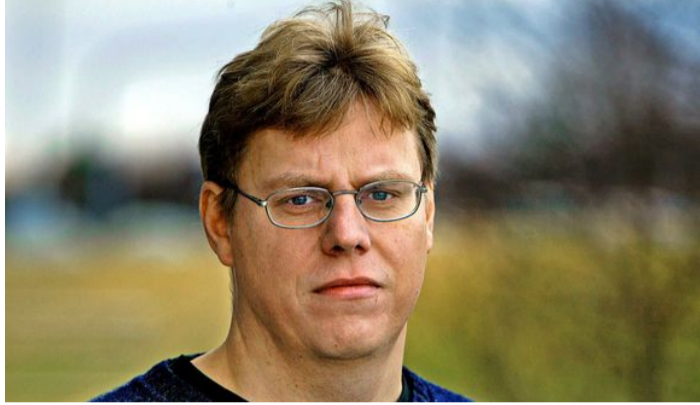
6.000 Íslendingar í verulegum spilavanda