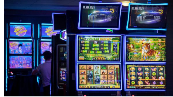
Mál íslensks spilafíkils fyrir MDE