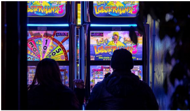
Amma spilafíkill - það er ég