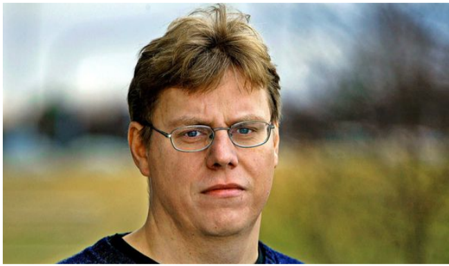
6.000 Íslendingar í verulegum spilavanda