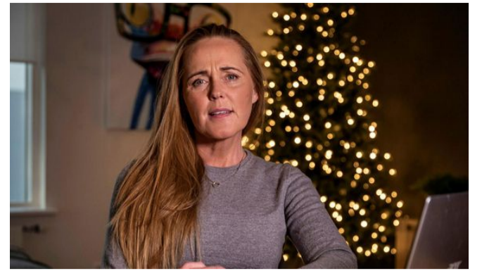
360.000 krónur á klukkutíma í spilakassa